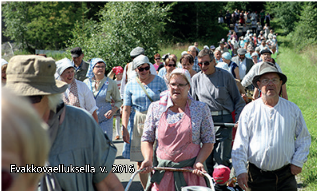
Evakkovaelluksella v. 2016

Miltä tuntuu pako kotiseudulta sodan jaloista? Evakkovaellus muistelee ja kunnioittaa Suomessa evakkoteille joutuneita.